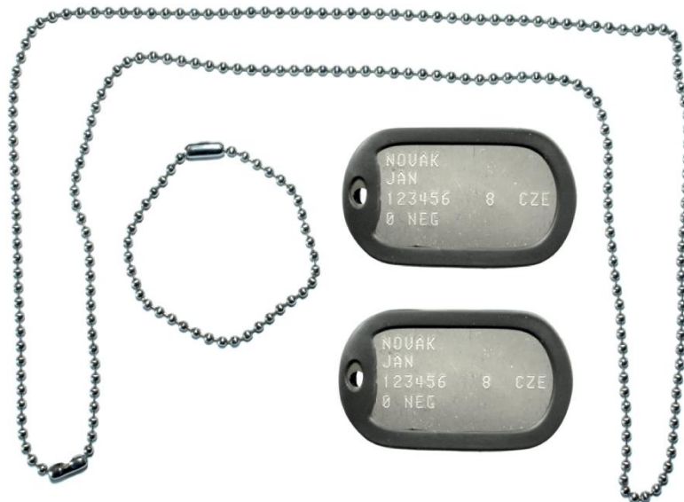
OBRÁZEK 1 – Vzor osobní známky

Vzor osobní známky je uveden na obrázku 1.